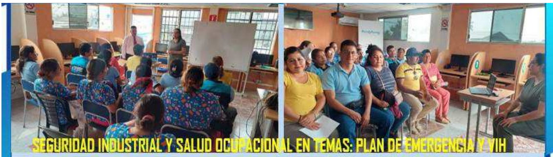
SEGURIDAD INDUSTRIAL Y SALUD OCUPACIONAL EN TEMAS: PLAN DE EMERGENCIA Y VIH