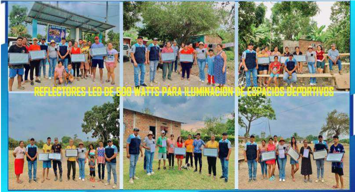
REFLECTORES LED DE 500 WATTS PARA ILUMINACION DE ESPACIOS DEPORTIVOS