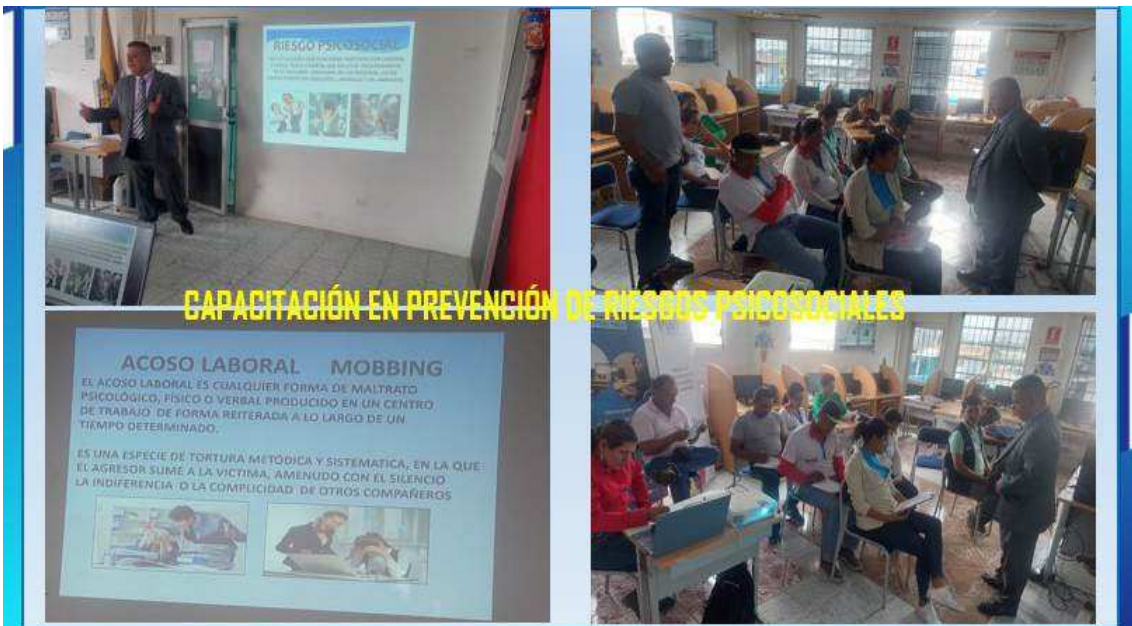
CAPACITACIÓN EN PREVENCIÓN DE RIESGOS PSICOSOCIALES