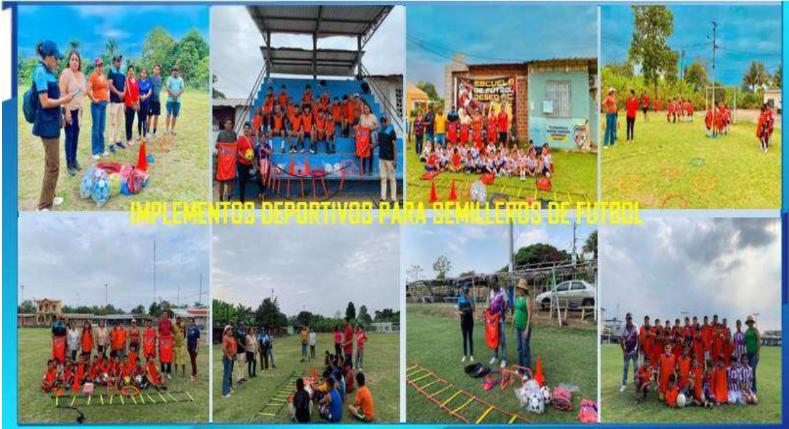
IMPLEMENTOS DEPORTIVOS PARA SEMILLEROS DE FUTBOL