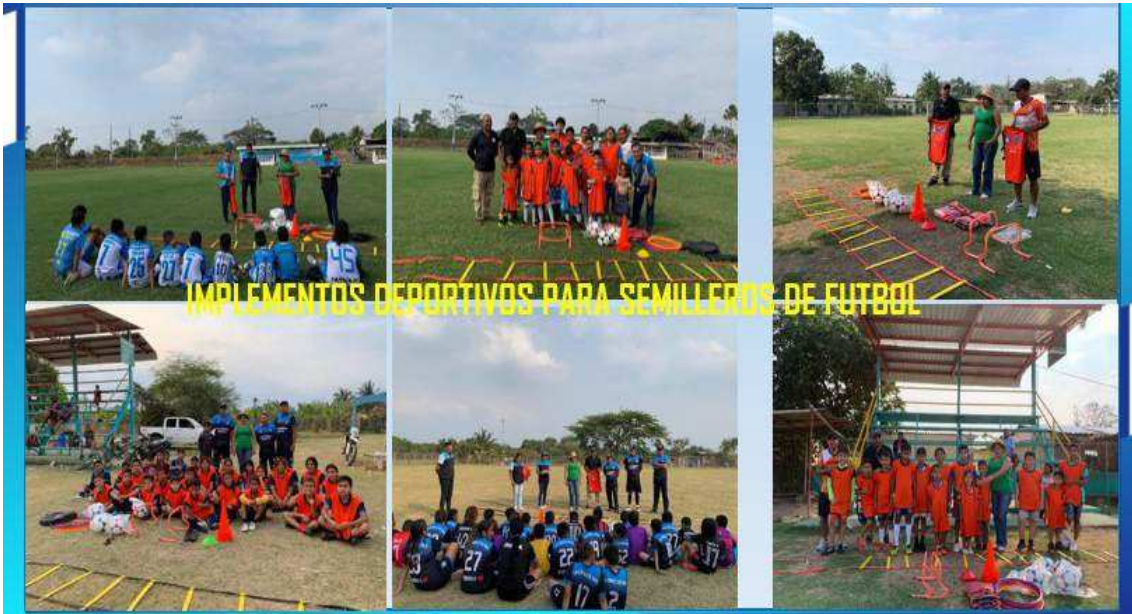
IMPLEMENTOS DEPORTIVOS PARA SEMILLEROS DE FUTBOL